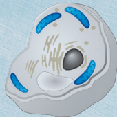
Mitoptose (Abbau geschädigter Mitochondrien)