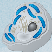
Replizierung gesunder, aktiver Mitochondrien

Dieses Verfahren ist einzigartig und neben den vielen molekularen Mechanismen der wesentliche Grund für den Erfolg der physikalischen mitochondrialen Therapie.