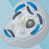
Zelle mit aktiven und inaktiven Mitochondrien

Obwohl beschädigte, überalterte Mitochondrien ständig „recycelt“ werden, ist eine aerobe Zelle, die zu viele funktionelle Mitochondrien verliert, aufgrund des fehlenden Energienachschubs nicht in der Lage, diese zu regenerieren, und stirbt ab.